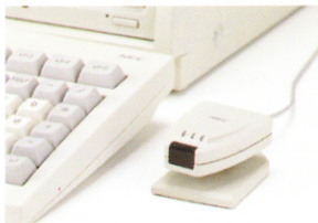
■赤外線通信インタフェースユニット(オプション)

ノートパソコンとのデータ送受信を容易にする赤外線通信機能や資産の共有に便利な前面アクセス可能なPCカードスロット*1に対応しています。